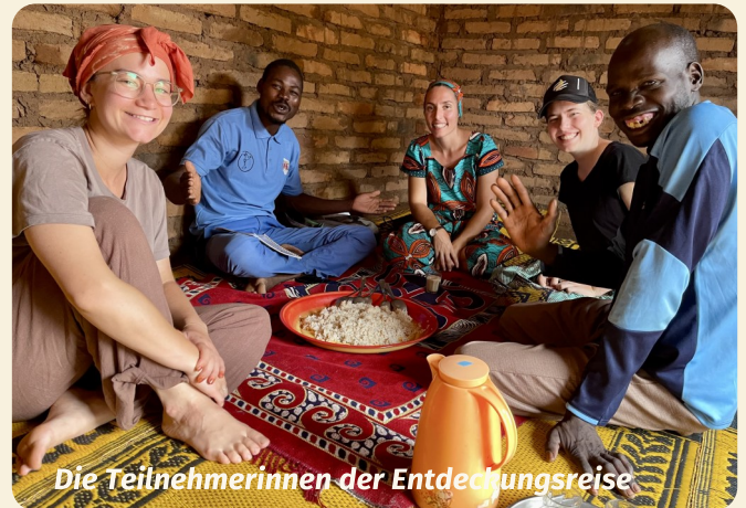
Die Teilnehmerinnen der Entdeckungsreise

Weitere eher übliche Aktionen konnten im Jahr 2025 ebenfalls durchgeführt werden: ein Stand bei CIP Solidaire (organisiert von der FICD, ein Solidaritäts- und interkultureller Tag, an dem sich Vereine treffen, die karitativ tätig sind und international arbeiten), ein Stand bei der Braderie Prêvôtoise , der Besuch mehrerer Kirchen in der Region, in Nyon und in Frankreich, um die Projekte der EMT und ihre Arbeit mit den Kirchen im Tschad vorzustellen.